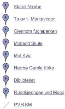
PV 6 KM - Google Maps

0 visninger - Offentlig Opprettet 19. Des 2010 - Oppdatert 19. Des 2010 Av